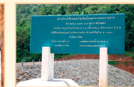
สภาพป่าที่อุดมสมบูรณ์บริเวณอ่างเก็บน้ำ