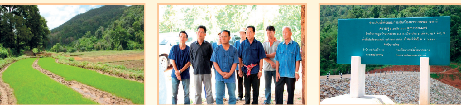
ราษฎรทำนาปลูกข้าวเหนียวโดยการโยนกล้า เพราะมีน้ำอย่างสมบูรณ์เพียงพอ

หน่วยงานที่เกี่ยวข้องและกรมชลประทาน พิจารณาแล้ว เห็นว่าในพื้นที่มีลำน้ำแก้วม มีต้นน้ำจากเทือกเขาสูงและไหลผ่านที่ราบ ซึ่งเป็นที่ทำกินของราษฎร โดยสภาพภูมิประเทศยังมีป่าค่อนข้างสมบูรณ์ ทำให้มีน้ำไหลทั้งปี อีกทั้งมีพื้นที่ที่มีศักยภาพในการสร้างอ่างเก็บกักน้ำได้ จึงดำเนินการก่อสร้างอ่างเก็บน้ำแม่แก้วม ที่หมู่ที่ ๕ บ้านปางอ้าย ตำบลเมืองปาน อำเภอเมืองปาน จังหวัดลำปาง ขนาดท่อนดิน กว้าง ๘ เมตร สูง ๒๘ เมตร ยาว ๑๕๐ เมตร เก็บกักน้ำได้ ๑,๐๖๔,๒๐๐ ลูกบาศก์เมตร โดยก่อสร้างแล้วเสร็จในปี ๒๕๕๗ สามารถส่งน้ำสนับสนุนพื้นที่การเกษตร ในฤดูฝนได้ ๑,๒๐๐ ไร่ และในฤดูแล้ง ๓๓๐ ไร่ ทำให้ราษฎร ๕ หมู่บ้าน ของตำบลเมืองปาน และตำบลบ้านขอ จำนวน ๘๓๙ ครัวเรือน รวม ๓,๐๒๙ คน มีน้ำใช้อย่างเพียงพอตลอดปี มีรายได้และคุณภาพชีวิตดีขึ้น นอกจากนี้ยังช่วยลดปัญหาหน้าไหลหลากเข้าท่วมพื้นที่อีกด้วย